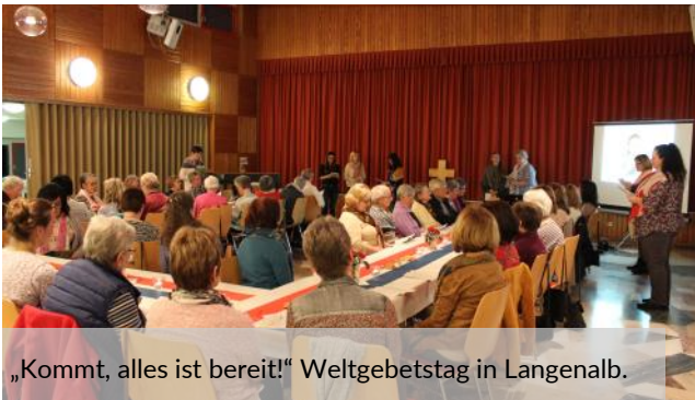
„Kommt, alles ist bereit!“ Weltgebetstag in Langenalb.

Dieser Abend bot tolle Texte, Lieder und Ideen, die berührten. Und anschließend waren die Gäste auch noch zum Essen und Probieren von allerlei slowenischen (und heimischen) Köstlichkeiten eingeladen – ganz nach dem Leitspruch des Abends: "Kommt, alles ist bereit!"