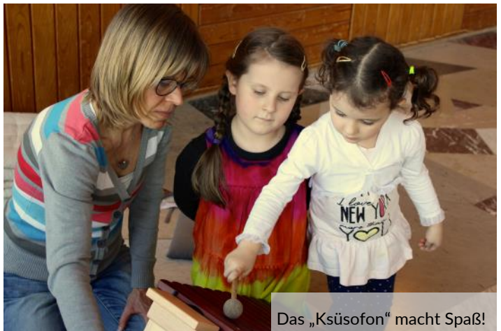
Das „Ksüsofon“ macht Spaß!

Wir suchen übrigens noch ein kleines Tischchen, auf das man das Glockenspiel stellen kann, und nach einem Schrank für die Musikinstrumente. Vielleicht haben Sie etwas Geeignetes noch im Keller stehen? Wir würden uns freuen!