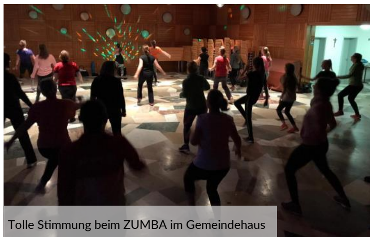
Tolle Stimmung beim ZUMBA im Gemeindehaus

Sie sind noch nicht dabei? Wir dürfen Ihnen verraten, dass tatsächlich alle Altersklassen und Fitnesslevel vertreten sind. Also nur Mut! Sie haben bei uns in jedem Alter Gesellschaft und eine Menge Spaß ist garantiert!