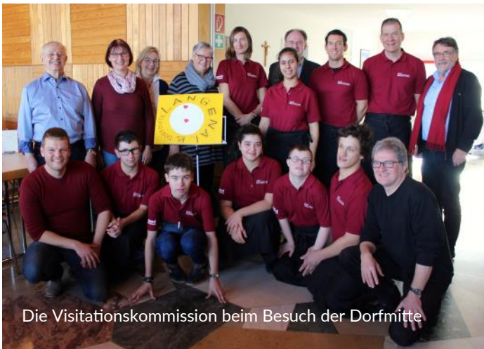
Die Visitationskommission beim Besuch der Dorfmitte