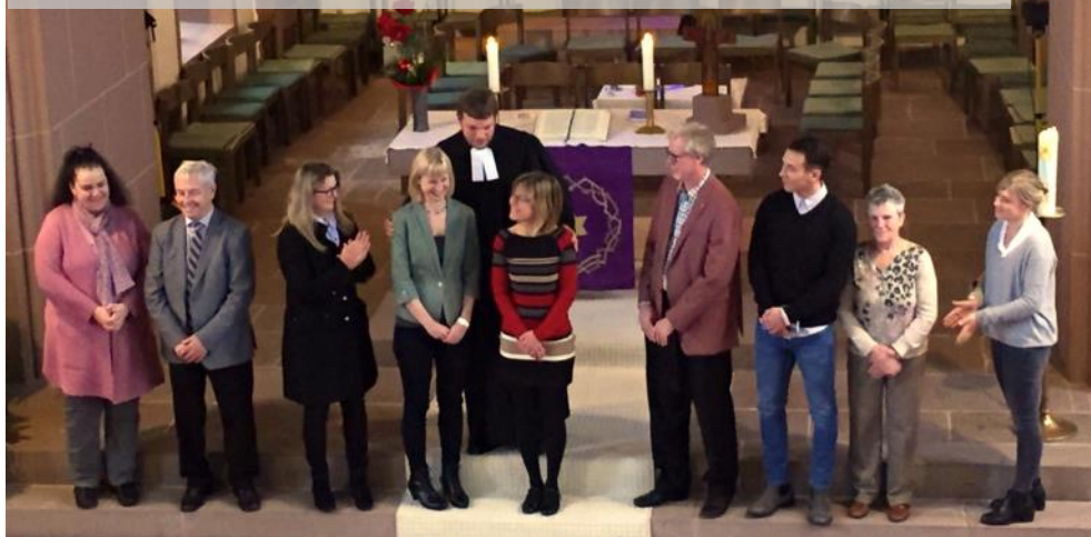
Strahlende Gesichter bei der feierlichen Amtseinführung im Dezember

Wenn Sie selbst gerne kandidieren wollen, möchten wir Sie trotzdem ganz herzlich dazu einladen! Denn wenn so viel Interesse besteht, kann der Gemeinderat beantragen, dass von der vorgegebenen Gremiengröße abgewichen wird.