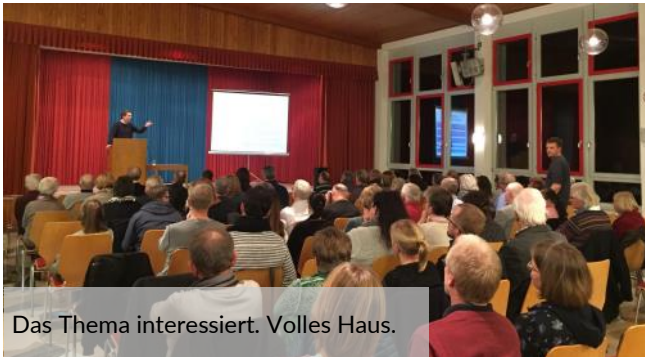
Das Thema interessiert. Volles Haus.

zwischen den Religionen sei es wichtig, sich seiner Identität bewusst zu sein und gleichzeitig andere Meinungen und Glaubensrichtungen zu tolerieren.