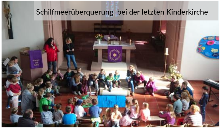
Schilfmeerüberquerung bei der letzten Kinderkirche

Impuls für die Großen. Bei der ersten Kinderkirchen-Mini-Predigt hat unser Pfarrer den Eltern versichert, dass sie ruhig auch dann auf Gott vertrauen können, wenn das Leben gerade gar nicht so läuft, wie wir uns das vorgestellt haben. Wenn Kinder in der Schule sitzen bleiben zum Beispiel. Weil sich manchmal nämlich erst im Nachhinein zeigt, wofür das so alles gut war.