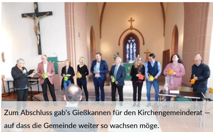
Zum Abschluss gab's Gießkannen für den Kirchengemeinderat – auf dass die Gemeinde weiter so wachsen möge.

(5) Die derzeit unbefriedigende räumliche Situation im Pfarramt soll