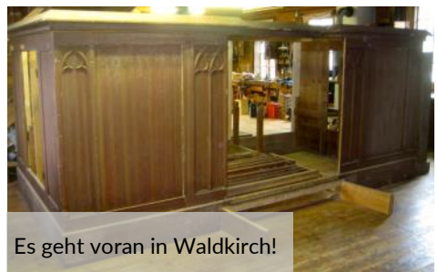
Es geht voran in Waldkirch!