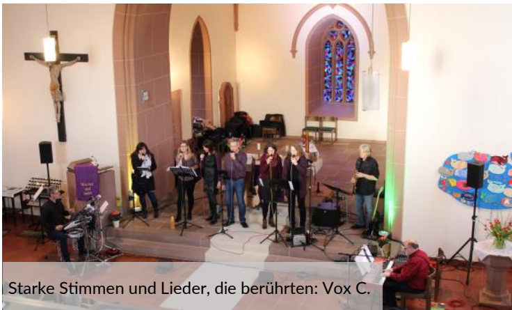
Starke Stimmen und Lieder, die berührten: Vox C.

Konzert wagten. Sie wurden binnen Sekunden eines Besseren belehrt. Die "Goldberg-Variationen" von Johann Sebastian Bach (1685-1750) werden mit ei-